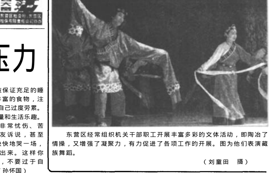
东营区经常组织机关干部开展丰富多彩的文体活动，陶冶了情操，又增强了凝聚力，有力促进了各项工作的开展。图为他们表演藏族舞蹈。